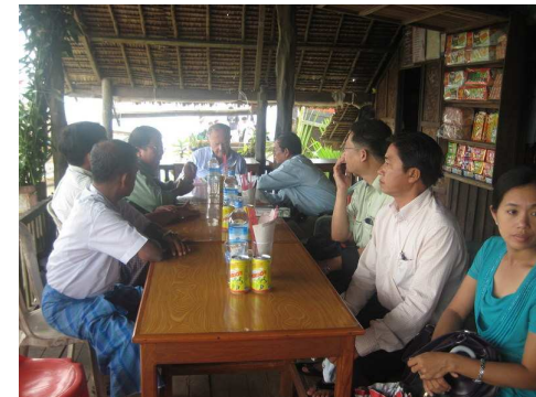
Décider en concertation