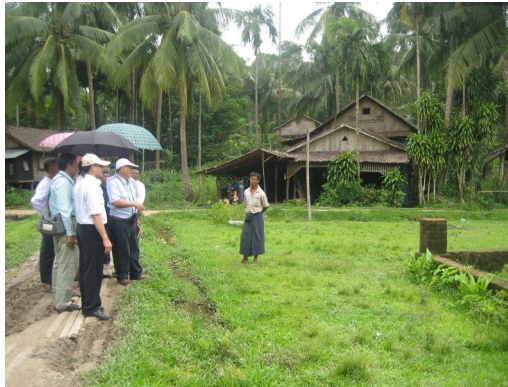
Proposition écartée à l'extérieur du village