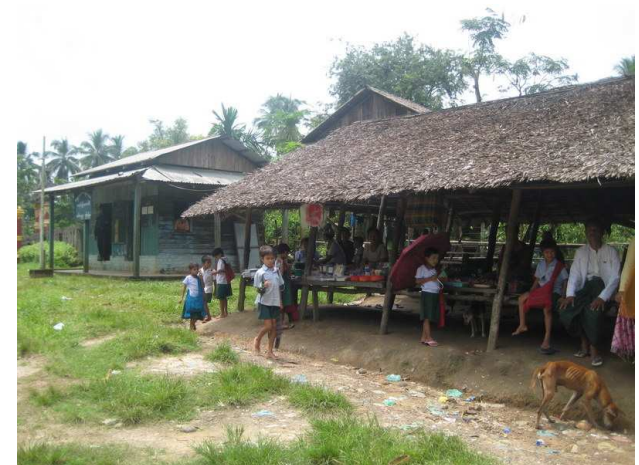
Le marché qui sera déplacé