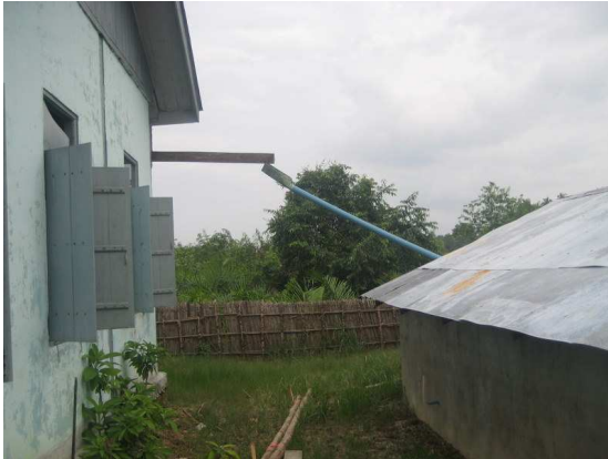
La récupération de l'eau de pluie

Ces trois dispensaires seront terminés en début 2009