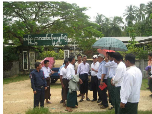
Concertation avec les villageois