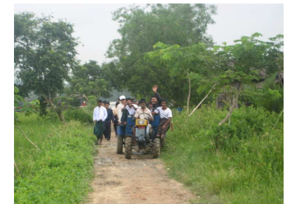
Moyen transport local : le tracteur