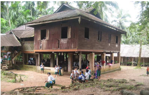
Deux écoles au centre du village