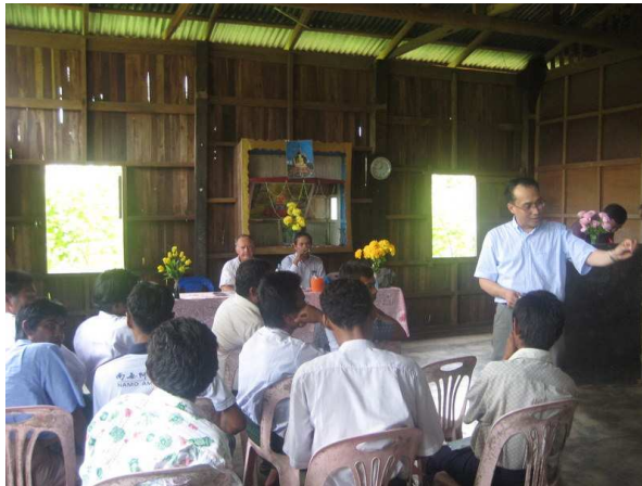
Faire de la prévention

Cette activité de dispensaires est donc devenue un projet à développer car les villages n'ont aucune présence de structures de soins, ni d'hygiène. Forte de l'expérience acquise par l'AMFA, plus au nord, avec la création en 2004 d'un premier dispensaire a Nagpali très performant et de trois autres construits et terminés dans la région en 2008, s'impose la nécessité de développer des structures mieux adaptées dans le sud du Myanmar à Myeick. Le projet a reçu les avis favorables des autorités locales.