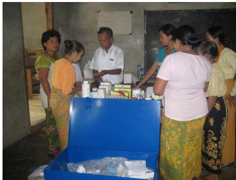
Distribuer les médicaments